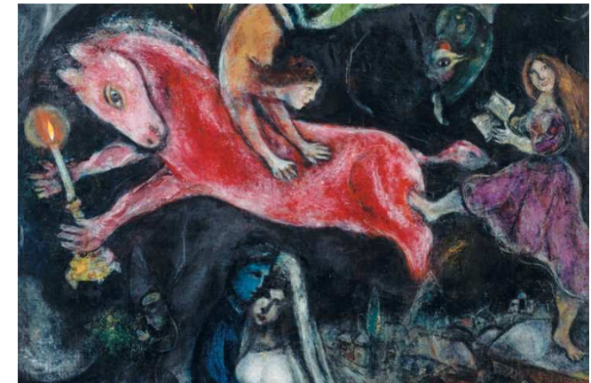
Le cheval rouge