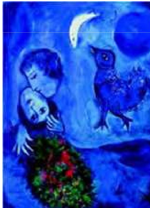
Le paysage bleu