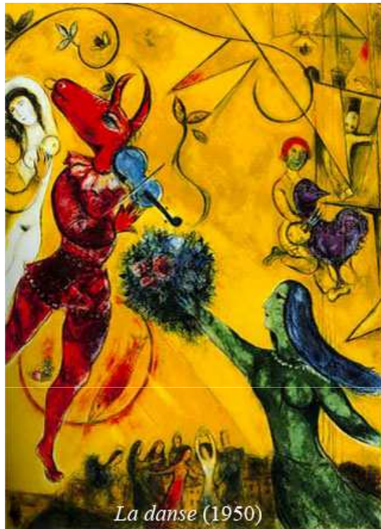
La danse (1950)

Comme Chagall aimait beaucoup la musique, les tableaux prennent souvent un petit air de fête grâce au bouc qui joue du violon , la chèvre du violoncelle ou bien la petite poule au tambour.