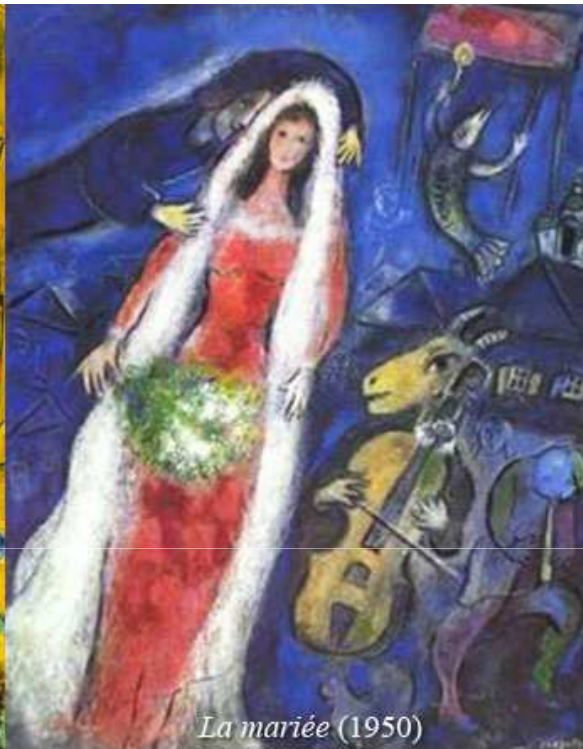
La mariée (1950)